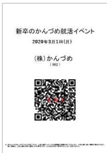
企業ブース QRコード(見本)